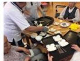
連携プレーを発揮

中部地方の郷土料理“五平もち”作りに挑戦しました。ご飯を少しつぶしたのち、小判形にして割り箸に刺し、ホットプレートでこんがり焼いて出来上がりです。すり潰したクルミ入りの甘味噌をたっぷり付けて頂きました。おいしいと皆様喜ばれていました。