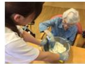
カー杯ごはん漬し