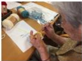
細かい作業もお手のもの

最近のデイでは編み物が流行しており、特にかぎ針編みのかわいらしいモチーフ作りを皆様楽しんでいます。分からない所はおたがい教えあったりと、新たな交流が生まれています。