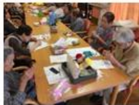
みなさま真剣です。