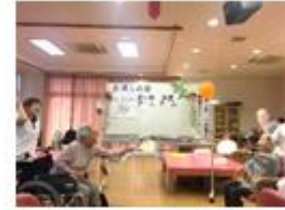
風船すもうゲーム