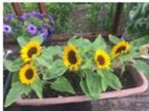
ひまわりが咲きました！

また日中はエアコンを効果的に使い、お部屋の温度を適切に保つように心がけましょう。5日の土曜日は年に一度の納涼祭です。ご家族様、お友達お誘い合わせの上、奮ってのご参加お待ちしております。