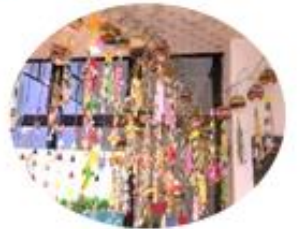
短冊に願いをこめて