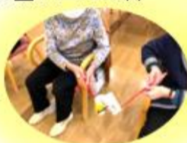
チーム戦の 物送りゲーム