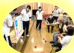
個人戦の まど当てゲーム