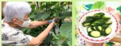
塩加減が絶妙と毎回大好評！

畑の野菜はぐんぐん成長しており、今日は収穫に挑戦です。お漬物にして昼食時に美味しく頂いています。