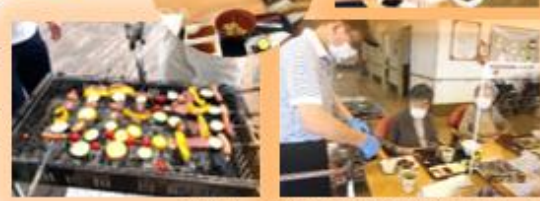
焼きたてを目の前で取り分け！

先月の22日、23日にお外のテラスでバーベキューを行いました。ウーロン茶かノンアルコールか選んで頂き、乾杯！美味しいと大好評でした。