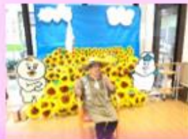
壁面の前で記念撮影

午後のゆったりとした時間、時には一人で集中、時には集団体操で連帯感が生まれたりとメリハリをつけて活動しています。