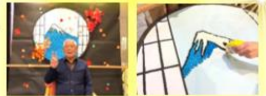
丸めたお花紙を一つ一つ丁寧にのり付け