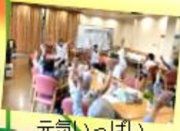
元気いっぱい 体操の時間

早いもので街中にはお正月飾りがちらほらと・・・ 今年一年、デイケアのご利用誠にありがとうございました！ 年末は何かと気ぜわしいですが、風邪には気を付けて、どうか良き辰年をお迎えください。皆様からのお正月のお話し、楽しみにしています・・・❤️