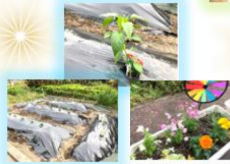
お花も次々と咲きだしました

昨年に引き続き今年もテラスの畑で夏野菜を育てています。今年は新たにスイカとトウモロコシに挑戦です！