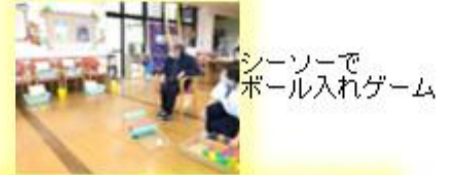
シーソーでボール入れゲーム

穏やかな午後の時間・・・時にはゲームで体を動かし、時には脳トレで頭を動かしながらメリハリをつけて活動しています。