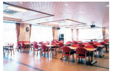
通所リハビリテーション