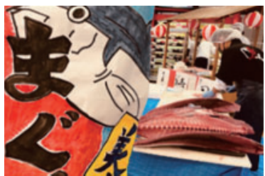
【マグロ解体ショー】

また、制作活動にも力を入れており、毎月ご利用者自身で取り組んで頂いた制作物をお持ち帰り頂いています。