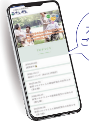
スマホからご覧頂けます