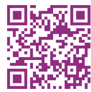
【だいせん ホームページ】

【2023年敬老祭】の様子はいせんホームページ及びインスタグラムで確認いただけます。