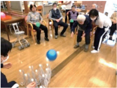
【レクリエーション】