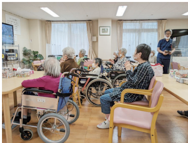
毎週日曜日はカラオケ