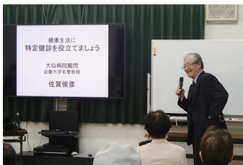
市民健康教室のようす

北条町から始まり、上野芝校区と徐々に範囲を広げて、今後も地域の皆様の健康維持・増進に継続して尽力していきたいと考えております。もし講演会などの希望の自治会などがありましたら是非お問い合わせください。今回は、秋ごろを目指して準備していきます。